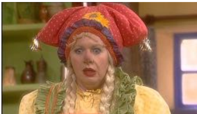
Kwebbel is ook blij vandaag

Het zonnetje schijnt, de bloemetjes staan volop in bloei. De zomer neemt bijna zijn intrede in het mooie kabouterbos. De bomen ritselen en zachte lentewinden van mei. Het gras is mooi groen en de ploppertjes zijn blij dat ze mogen buiten zijn. Want we gaan WATERSPELLETJES spelen.