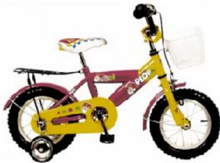
Dit is een fiets

De Ploppertjes hebben een gemengde verassing in petto. Kom met jullie plopfietsjes aan het lokaal en jullie zullen versteld staan van wat jullie te wachten staat.